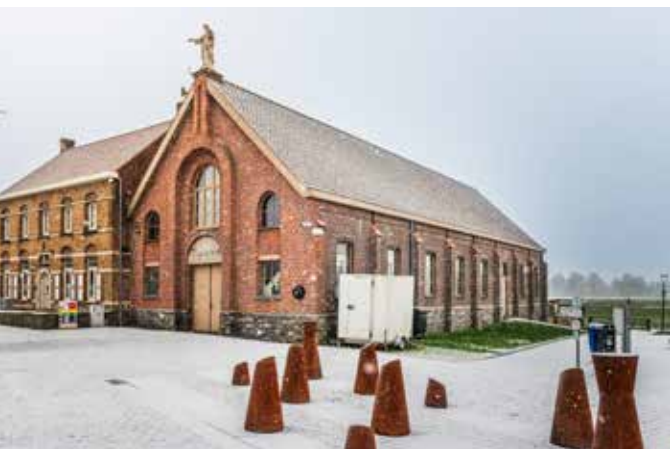
De kerk van Wielsbeke kreeg als een van de eerste een nevenbestemming als bibliotheek.