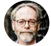
Peter De Roover

De Vivaldi-regering sloot het jaar af zoals we haar kennen: met een belastingverhoging. Tussen Kerstmis en Nieuwjaar kwam het parlement bijeen om bijna 200 miljoen euro extra belastingen goed te keuren. ‘Geen akkoord om een belastingshift door te voeren, maar wel alles uit de kast halen om belastingen te verhogen. Dat is Vivaldi ten voeten uit’, zegt Kamerfractievoorzitter Peter De Roover.